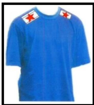
Количество погон у участников