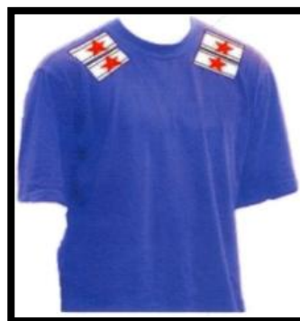
Количество погон у капитана

Погоны должны нашиваться РОВНО по шву плеча участников команды: